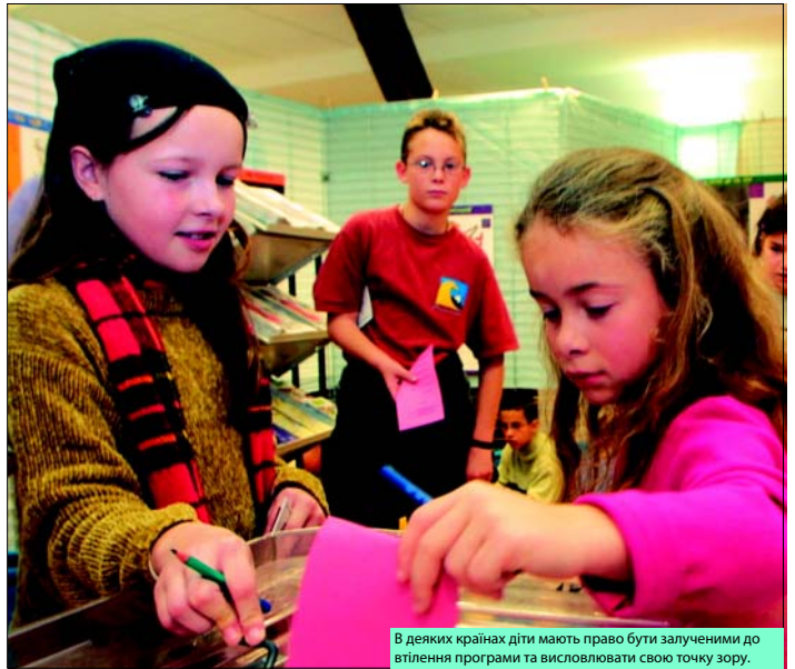
В деяких країнах діти мають право бути залученими до втілення програми та висловлювати свою точку зору.

Програма "Розбудова Європи для дітей та з дітьми" займається розв'язанням двох